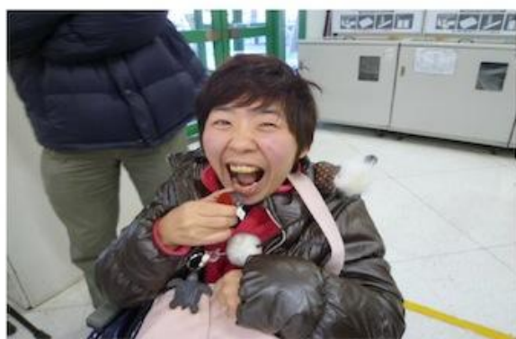
流通経済大学の学食は うまくて安い!!