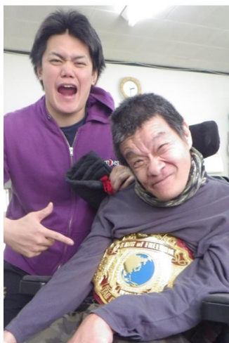
↑喜楽家スタッフ兼プロレスラーのスキウラマンが、KFCタックチャンピオンになりました!!(拍手〜!!)