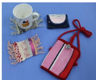
コースター・ポーチ・小銭入れ(さき織班作)↑

☆☆☆☆☆☆☆☆☆☆ 地域の方からの供出物や、メンバーが自分たちで作った作業作品を販売しています。ぜひお越しください♪ ☆☆☆☆☆☆☆☆☆☆