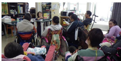
↑スタッフによる童話読み聞かせゲリライベント。皆、集中しています…